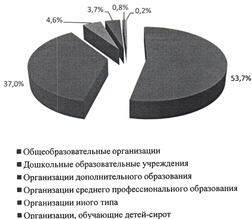
Рисунок 1. Структура образовательного пространства Республики Хакасия

На территории Республики Хакасия находятся три учебных заведения высшего образования: Хакасский технический институт – филиал федерального государственного автономного образовательного учреждения высшего образования «Сибирский федеральный университет», Саяно-Шушенский филиал федерального государственного автономного образовательного учреждения высшего образования «Сибирский федеральный университет», федеральное государственное бюджетное образовательное учреждение высшего образования «Хакасский государственный университет им. Н. Ф. Катанова».