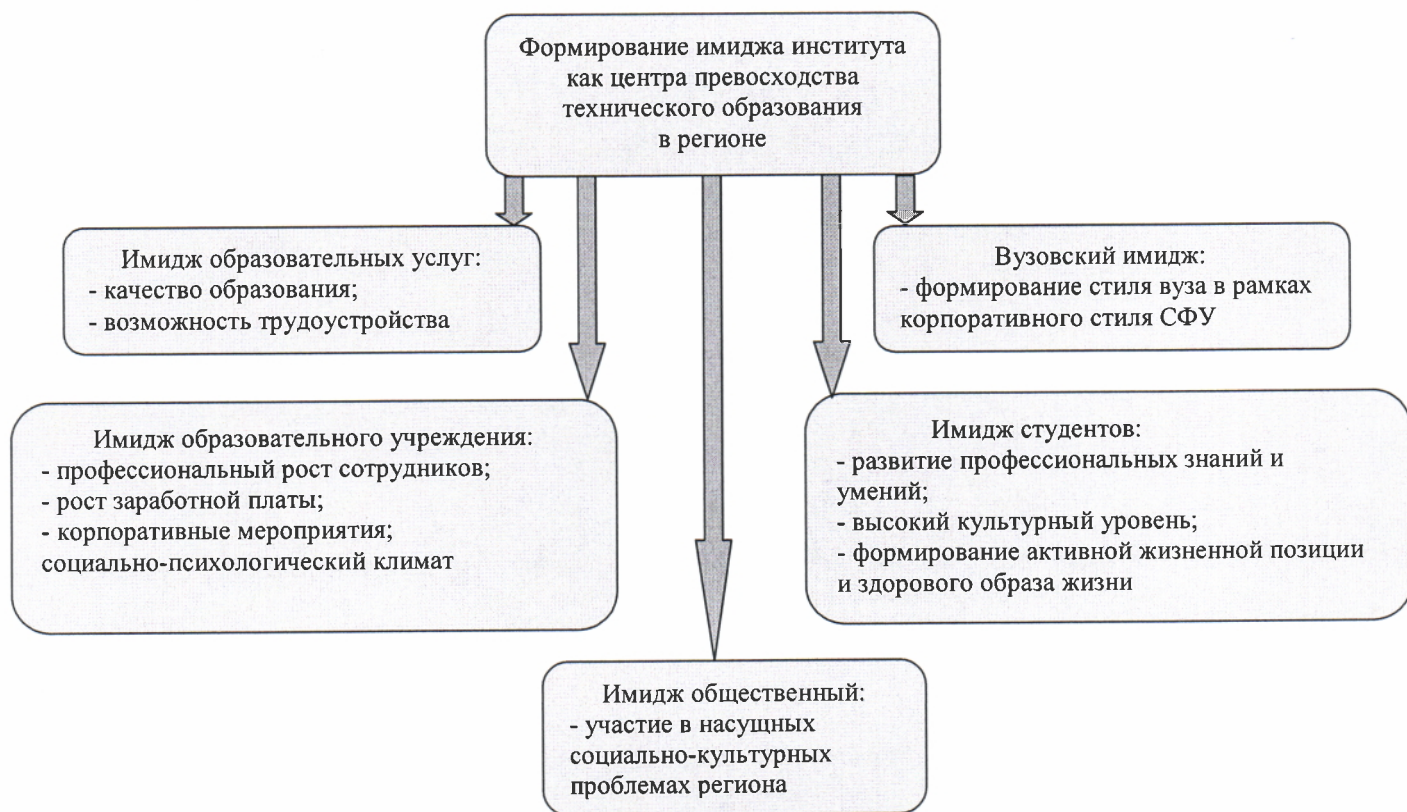
Рисунок 4. Имиджевая политика ХТИ – филиала СФУ

Для формирования имиджа ХТИ – филиала СФУ (рисунок 4) как регионального центра превосходства инженерного образования планируется повысить: